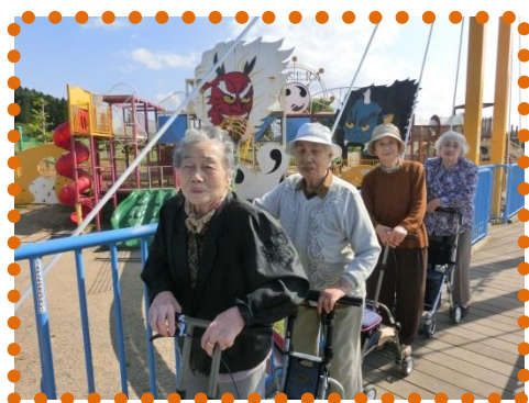
ドライブ (わくわくランド)

デイサービスセンター和幸では、 入浴・食事・健康チェック・機能訓練・趣味の活動・季節の行事・ドライブ などを取り入れ、皆様に楽しんでいただいております。 お気軽にご利用ください。